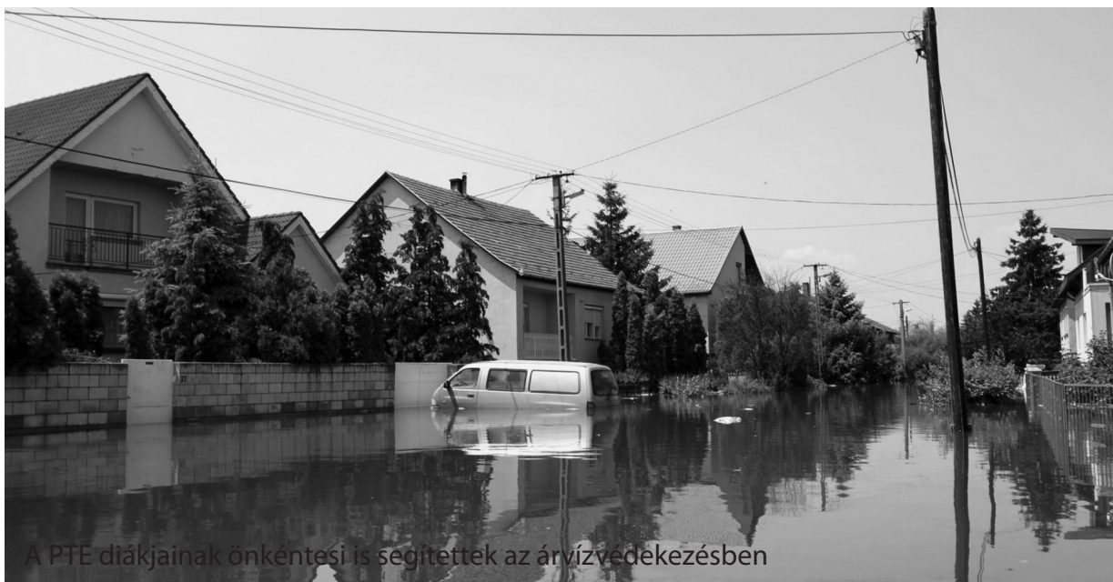
A PTE diákjainak önkéntesi is segítettek az árvízvédekezésben