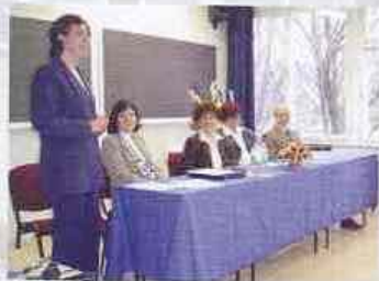
Ökoprof. Vándornő Nap