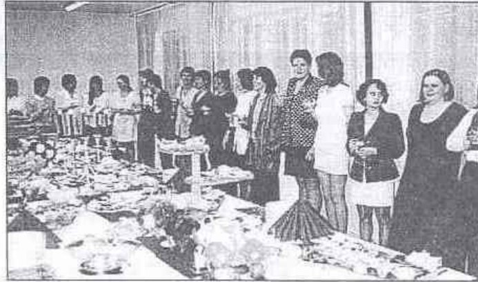
Az állófogadás kezdete: hallgatók a terített asztal körül