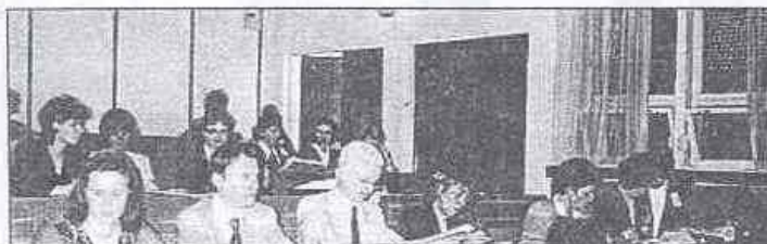
Munkában a Diplomás Ápoló Szekció zsűrije