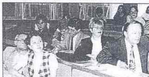
A Gyógytornász Szekció zsűrije