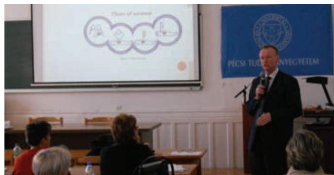
Szakmacsoportos továbbképzés Szombathely 2013. január 30-31.