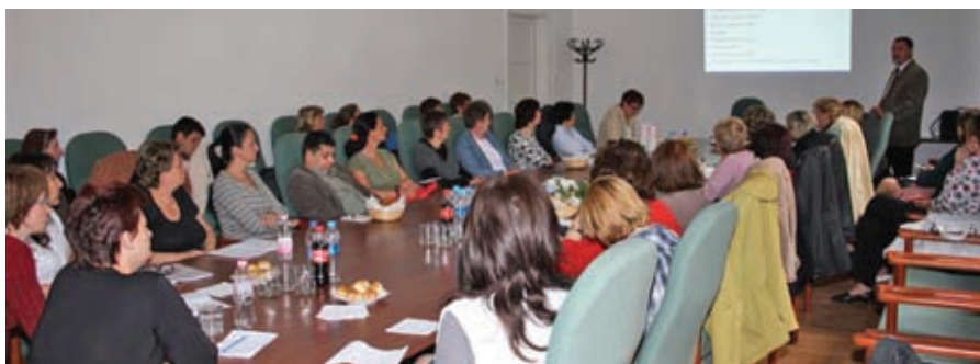
Szakmai egyeztetés (2013. május 23. Pécs)

A 2013. január 11. - 2013. május 9. közötti időszakban mindösszesen 23 szakmacsoportos továbbképzés került megszervezésre, melyen 1674 fő vett részt. A szakmacsoportos továbbképzések részletes bontását az alábbi táblázat tartalmazza: